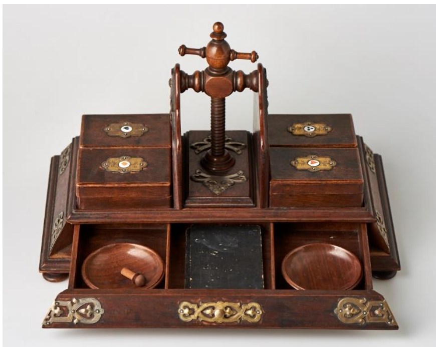
1880 körül készült kártyaprés az Iparművészeti Múzeum gyűjteményében.

A kártyaprés a kor számos polgári lakásának alapkelléke, ugyanakkor dísz is volt, amely készülhetett fából, fémből, de akár márványból is. A játékkártyákat ekkoriban háromrétegű írópapírból készítették, ami a használaton kívüli kártyalapok meggörbüléséhez vezethetett, a kártyaprés szorításában azonban a lapok a következő játékig megőrizték egyenességüket. Ezenfelül a tárgy fiókjai, rekeszei egyéb, a játékhoz szükséges kellékek tárolására (például zsetonok) is szolgáltak.