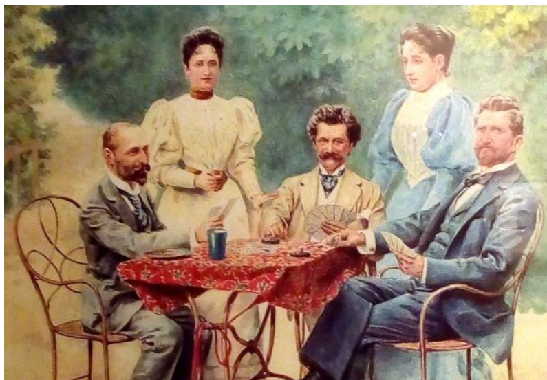
Tarokk parti Johann Strauss-nál Bad Ischl-ben