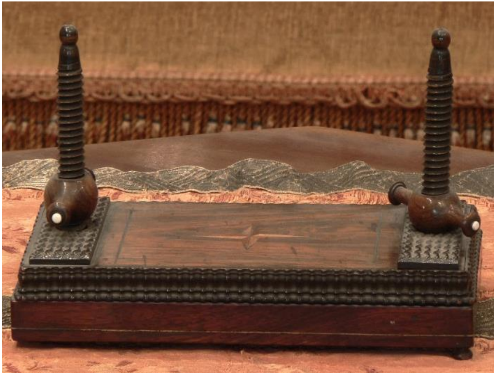
Liszt Ferenc kártyaprése a Liszt Ferenc Emlékmúzeum szalonjában.

Ez a kis tárgy Liszt idejében fontos feladatot látott el; minden bizonnyal az igen gyakran igénybe vett kártyalapokat egyengette, hiszen nagy művésznünk – bár lehet, kevesen tudják – szenvedélyes whist [viszt] játékos volt. Főként idősebb korában számára „boldogtalan volt az a nap, amelyen rendes whist-partiját nem játszhatta” (Szomházy). Alkalmanként piquet-et is játszott, egyébként a szerencsejátékot – több zeneművész kortársával ellentétben – nem szívelte.