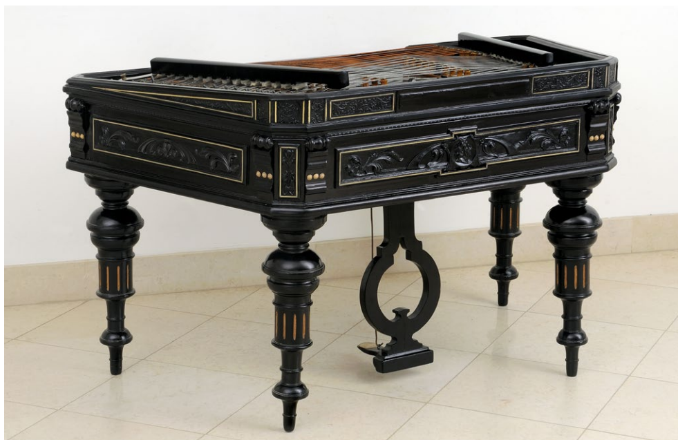
1. illusztráció: Liszt portréjával díszített, Schunda-féle pedálcimbalom

Tőlünk nyugatra a nemzeti összetartozás érzése már nem a közös történelmen, hanem sokkal inkább a közösen birtokolt szabadságjogokon és a néhány generáció alatt megteremtett jóléti társadalmon alapul. A magyar közgondolkodásban azonban fontosabb szerepet játszik a történelem, mint a nyugat-európaiban, és historizáló önképünknek szüksége van nemzeti szimbólumokra. Egy a nemzeti hangszereket nyilvántartó internetes adatbázis listáján magyar nemzeti hangszerként a cimbalom van feltüntetve. 1 (1. illusztráció)