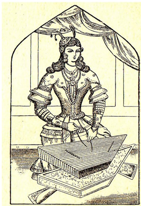
4. illusztráció: Santúron játszó női zenész