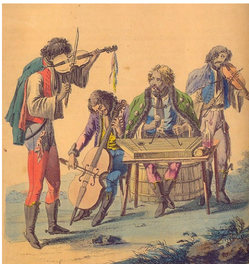
3. illusztráció: Cigányzenekar ábrázolása Bikessy-Heinbucker 1816-os festményén

Ennek köszönhetően vélte Liszt a nemzeti közfelháborodást keltő A cigányokról és a cigány zenéről Magyarországon (eredetileg Des Bohémiens et de leur musique en Hongrie , Párizs, 1859) című könyvében, hogy a cigányzenekar alapja mindig a hegedű és a cimbalom volt. 12 A cigányzene vagy magyar zene kérdésben jogos kritikák visszatérő mozzana-