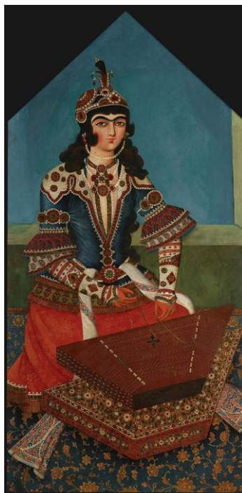
5. illusztráció: zantúron játszó női zenész ábrázolása az 1850-es évekből

Szintén hozzájárulhatott a perzsa santúr európai elterjedésének téves elméletéhez Haraszti Emil, aki könyvében a South Kensington Múzeum egyik festményéről készített rajzos ábráját a perzsa santír 15. századi ábrázolásaként adja meg. 24 Haraszti azonban csak átvette az adatot, és az ominózus kép forrásaként Hortense Panum 1915-ös hangszertörténeti munkáját adta meg. 25 Az eredeti olajfestmény azonban a Kádzsár dinasztia (1785–1925) idejére jellemző stílusban, 1840 körül készült. Ez egyben az ütött húros perzsa santúr jelenleg ismert legkorábbi ábrázolása. Ezért bár a hangszertípus 1660-as évekbeli perzsa megjelenésével mindenképpen lehet számolni, 26 a Keleti-Alpok területéről azonban már a 15. század közepétől folyamatosan adatosható az ütött húros cimbalom jelenléte. 27 (4–5. illusztráció)