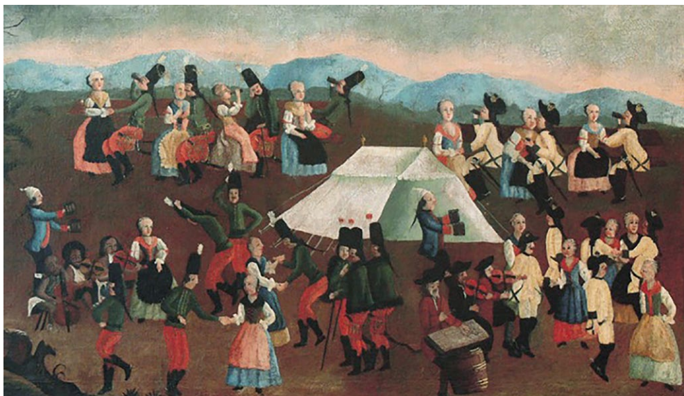
6. illusztráció: Zsidó és cigányzenészek ábrázolása (Felső-Magyarország 1760-70)