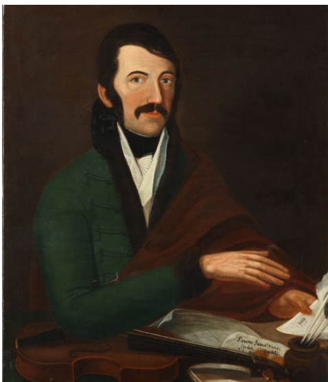
5. illusztráció: Ismeretlen művész: Lavotta János, 1800 körül, Magyar Nemzeti Múzeum Történelmi Képcsarnok, ltsz. 1520

Bár indoklást nem találunk, hogy pontosan miért kerültek fel a festmények a listára, feltételezhetjük, hogy a nehéz anyagi helyzetben lévő intézmény a festmények értékével is növelni kívánta a vételárat, hogy még kedvezőbb ajánlatot kapjon. Mindenképpen fontos kiemelni, hogy nem a könyvtár eladása, illetve a másik oldalról a megvásárlása volt az elsődleges cél, ez csak egy eszköz volt egy közel száz éves múltú zenei intézmény megmentésére, anyagi támogatására.