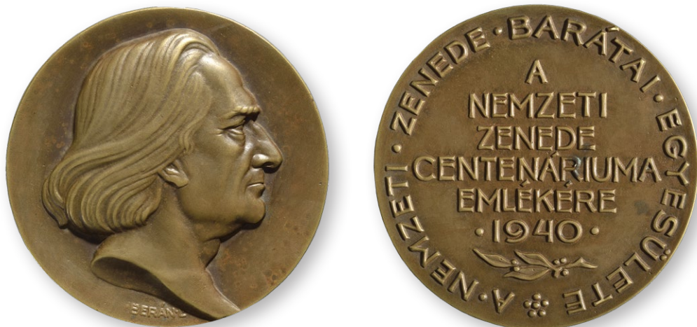
2. illusztráció: Berán Lajos: A Nemzeti Zenede centenáriuma, 1940, Zenetörténeti Múzeum, ltsz. 10.415 (elő- és hátlap)

Érdemes kiemelni Bartay előterjesztéséből azt a részletet is, miszerint lényegesnek tartotta, hogy Liszt Ferenc portréja „valamilyen kitünő hazai művész ecsete által” örökíttessék meg. A Zenede számára a magyar nyelv és kultúra ápolása, a nemzeti művészet előmozdítása mindig is központi kérdés volt már az 1840-es és 1850-es évektől kezdve. Zenetörténeti szempontból kiemelkedő jelentőségű például, hogy magyar szellemiségű zeneműpályázatokot írtak ki. Emellett hozzájárultak a magyar portréművészet támogatásához is. A magyar zene terjesztése körül érdemeket szerzett személyek arcképeit éppen ezért hazai mesterektől, többek között Barabás Miklóstól, Kern Hermann Ármintól, Lieder Frigyesztől és Vastagh Györgytől, vagy éppen esetünkben Than Mórtól rendelték meg.