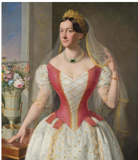
4. illusztráció: Lieder Frigyes: Hollósy Kornélia, 1850, Magyar Nemzeti Múzeum Történelmi Képcsarnok, ltsz. 1519