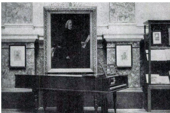
6. illusztráció: Liszt Ferenc kiállítás a Nemzeti Múzeumban, 1936 (Tükör, Budapest, 1936. július, 4. évf. 7. szám)

Az olajkép bemutatott életútja, úgy gondolom, jól reprezentálja a Nemzeti Zenede műpártolásának köszönhetően létrejött és összegyűjtött műalkotások intézményes háttérét, a leleplezési ünnepeken keresztül a portrék végső elhelyezéséig. Zárszóként pedig hadd idézzem ismét Murányi Kálmán Engeszer Mátyás kórusművéhez írt néhány sorát, amely épp úgy Liszt nagyságát fejezi ki, mint Than Mór reprezentatív festménye: „bár a magas égen is csak egy a nap, sugáriból mégis egész világ kap”. 25