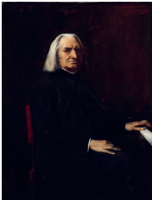
3. illusztráció: Munkácsy Mihály: Liszt Ferenc portréja, 1886. olaj, vászon, © Szépművészeti Múzeum - Magyar Nemzeti Galéria 2024, ltsz. 2820