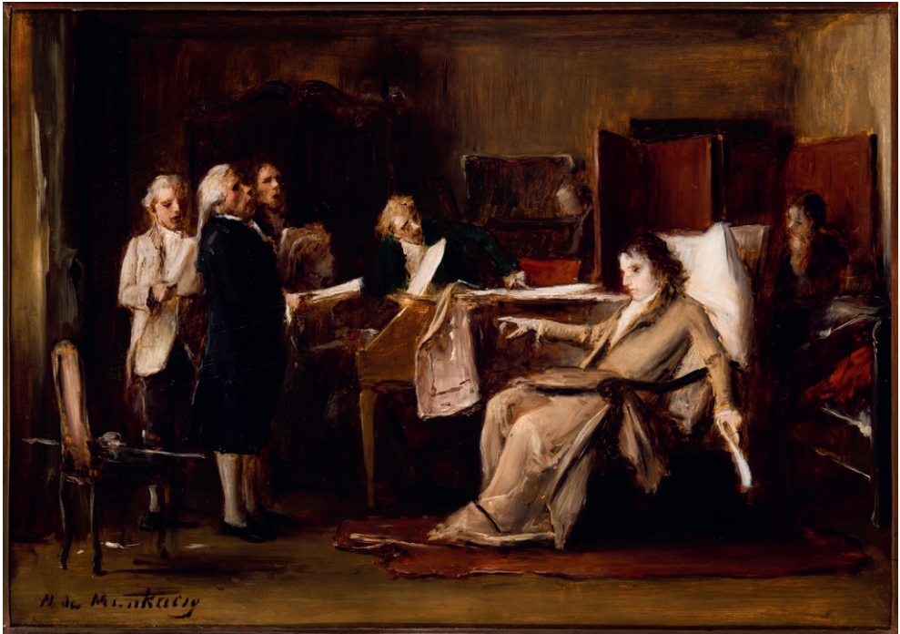
1. illusztráció: Munkácsy Mihály: Mozart halála (vázlat), 1886. olaj, vászon, © Szépművészeti Múzeum - Magyar Nemzeti Galéria 2024, ltsz. 50.520

Zene és képzőművészet összekapcsolódása, a köztük lévő átjárhatóság elve a 19. századra jellemző felvetés volt. E nézet szerint a különböző művészeti ágak csupán nyelvezetükben térnek el egymástól; így egy festmény képes lehet ugyanolyan tartalmi mélységeket hordozni, mint egy zenemű, és fordítva, s a kettő jól kiegészíti egymást. Wohl Janka 1887-es megemlékezéseiben olvashatjuk, hogy Wagnerrel ellentétben, aki a festészetet nem tartotta sokra, 13 Liszt „azt állította, hogy zene és festészet egybeolvadnak és kiegészítik egymást.” 14 Liszt életművén valóban végigível társművészetekről alkotott elképzelése. Nem csupán arról van itt szó, hogy a zene nyelvére ültetett át művészeti alkotásokat (tette pedig ezt a 19. században elsőként), 15 de az ezen zeneműveket felölelő programzene terminus is tőle származik. Hogy