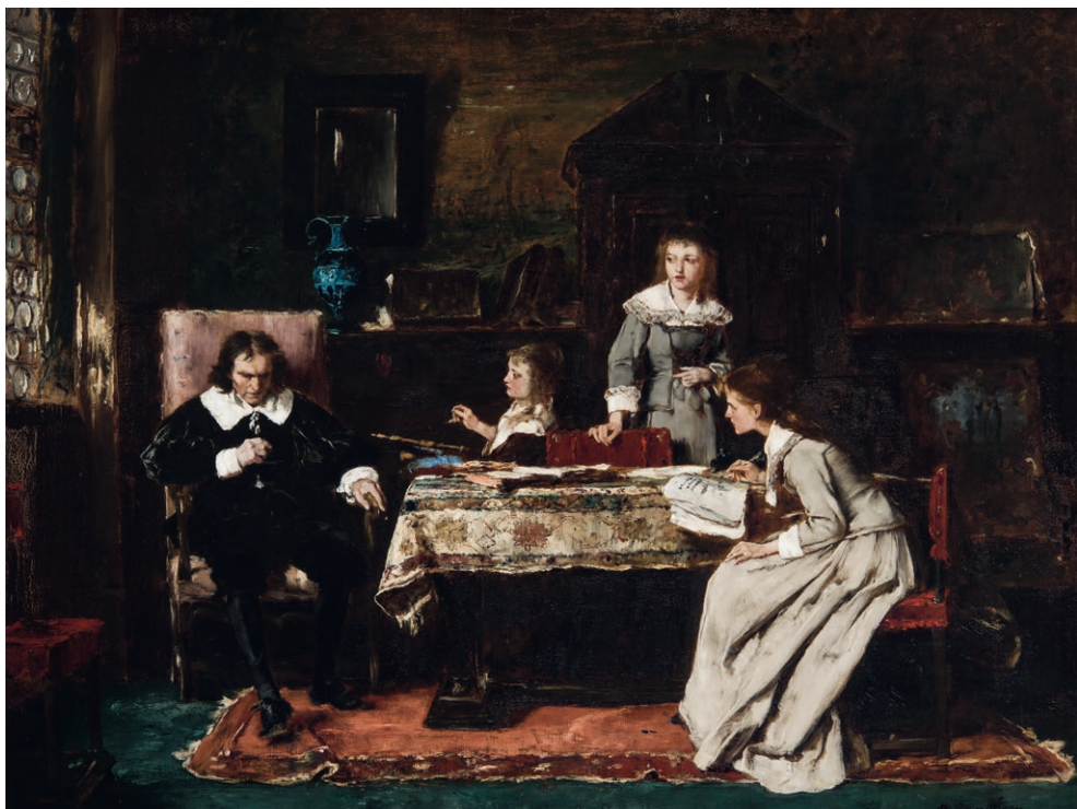
2. illusztráció: Munkácsy Mihály: Milton, 1878. olaj, vászon. MNG, ltsz. 69.128T

Ha máskor nem is volt rá lehetőségük, ezen alkalmakkor bizonyonnyal tartalmas eszmecserék folytak a két géniusz között, és barátságuk elmélyülhetett. A festmény fontosságát növeli a tény, hogy ez az utolsó olyan ismert portréfestmény Lisztről, melyhez a mester személyesen modellt ült. Érdeemes itt megjegyezni, hogy Munkácsy az alkotás során a ma már csak Louis Held másolataiból ismert, eredetileg Párizsban készült fotókat is biztosan segítségül hívta, mely gyakorlatot a festő már ifjúkorában megszokta. 29 (4. illusztráció) E módszer segítségével a portré pár hét, hozzávetőlegesen egy hónap alatt el tudott készülni, úgy is, hogy ez alatt az idő alatt Lisztet kötelezettségei nemcsak Párizsban, de később Angliában is sokféle szólították. Számos meghívásnak és programkötelezettségnek kellett eleget tennie, ami igen megerőltető lehetett az idős mesternek. Ezek közül kiemelkedő helyen szerepel március 23-a, mikor Munkácsyék estélyt adtak Liszt tiszteletére. Ezen az összesen mintegy 500 vendéget számláló eseményen a francia értelmiség számos képviselője jelen volt, a zenei életből például Camille Saint-Saëns is, aki Louis Diémerrel előadta a házigazda tiszteletére a 16. Magyar Rapszódia t, később pedig maga Liszt is zongorához ült.