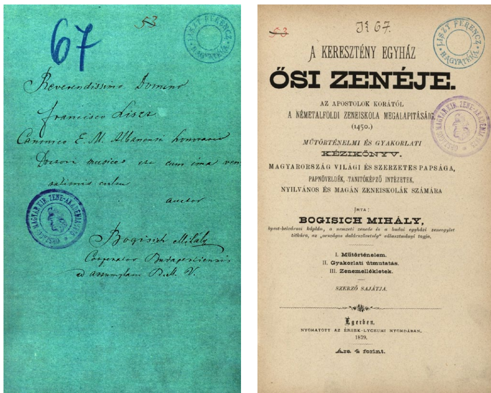
4. illusztráció: A keresztény egyház ősi zenéje, Liszt Múzeum.

Liszt nemcsak a hercegrímás előtt képviselte Bogisichot és könyvét, hanem a pápához is eljuttatta a könyv egy példányát. Ebben Gustav Hohenlohe-Schillingsfürst bíboros volt a segítségére. 1880. január 22-i levelében Liszt beszámolt Hohenlohe bíborosnak arról, hogy tájékoztatta a szerzőt a könyv bemutatásáról a pápának. Egyúttal biztosította a bíborost arról, hogy kérdés esetén Simor hercegrímás ajánlani fogja a könyvet. 37 Bogisich ismeretlen kérelme valószínűleg erre az ajánlásra vonatkozott. A könyv bemutatása a pápának még 1880. február 24-e előtt megtörtént, ugyanis ezen a napon írt levelében Liszt arra kérte Carolyne Sayn-Wittgenstein hercegnét, hogy köszönje meg a bíborosnak a nagylelkű szívességet. 38